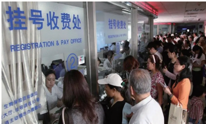
| 중국 병원 접수처 |