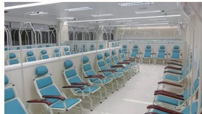
| 중국 병원 수액실 |